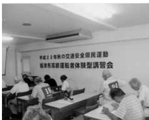
高齢運転者体験型講習会

車の運転が就業に必要な六十歳以上の会員を対象に、毎年、福津市交通安全協議会主催の「高齢運転者体験型講習会」に五名程度参加し、実習を通じた運転技術の再確認などの講習を受けます。