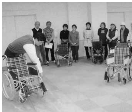
バリアフリー講習会