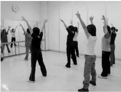
エアロピクスを楽しむお母さん方