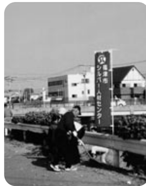
西郷川アジサイロード

二十二年会員互助会のボランティア活動は、左記の表の通りです。 延べ三百名近くの会員と地域の方々と一緒に汗を流し、学校においては、父兄や先生方と協力して、事故なく終了することができました。 そのほか、同好会活動においても、趣味をいかしたボランティアを行っています。