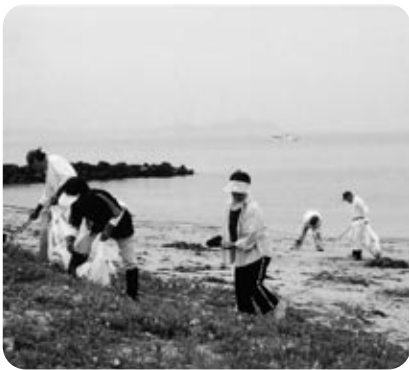
西郷川河口周辺美化活動