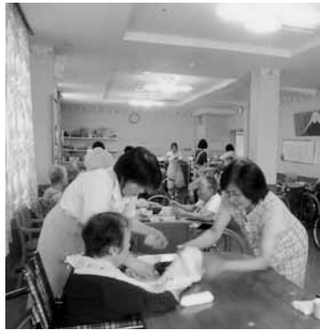
筑前顕慈園にて介護実習