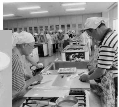
高齢者向け 料理講習会