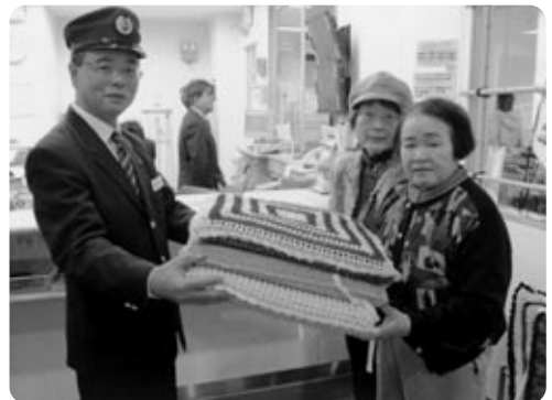
手芸同好会より JR福間駅へ ぎぶとん(8枚) 寄贈