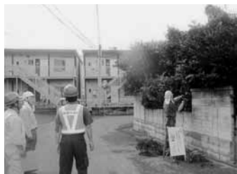
屋外作業 安全パトロール

会員の加齢による判断能力の低下・体力の低下等に起因する事故を防止するために、自分の体力について再認識し、健康管理に役立つように体力測定を地域班活動に取り入れて実施します。