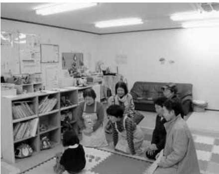
直方市シルバー人材センターへ 子育て支援視察研修