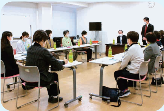
11/30 岡山県浅口市・井原市シルバー人材センター合同研修（女性会員拡大会議）