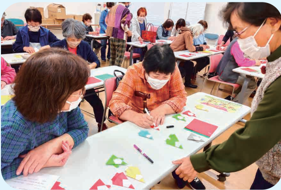
11/8 折り紙サロン（市民60歳以上対象）