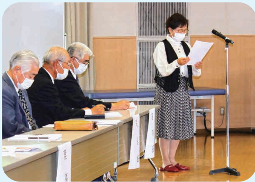
定時総会での専さん

議がありました。写真担当が自分やれそうだと希望しました。作業記録用の撮影は位置確認から始まり、除草作業をしながら、作業前・作業中・仕上げと終了後の計4回行う必要があります。ベテラン先輩の見習いに付き、準備と丁寧な作業、安全行動は大いに参考になっています。街路で除草作業をしていると、散歩中の人が「草取り作業に女性もいるんですね。寒いから風邪ひかないように。お疲れ様」と声をかけてくださいます。このありがたい一言が仕事の励みになり疲れもとれます。女性が活躍している場を見てもらえるのは嬉しいし、男性との共同作業で共に働き学び、女性活躍の場を広げていくのもよい方法ではないでしょうか。働きたいと思っっている女性の方への刺激になればいいなと思っています。