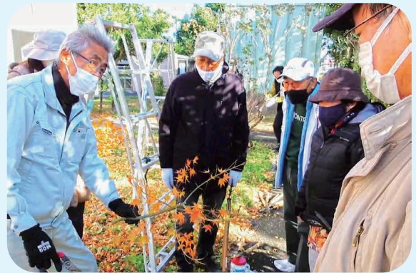
12/8 剪定講習会（市民60歳以上対象）