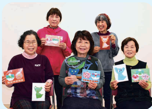
2/14「なの花会」にて（前列左が専さん）

この会は月に1回（毎月第2水曜日）開催しています。折り紙・手芸・写真・ハーブなどを楽しんだり、おしゃべりしたりと、いろんな企画を考えて楽しく活動しています。現在女性会員の仲間も増えてきています。皆さんもシルバー人材センターに入会してご参加下さい。私たちと一緒に活動しませんか。